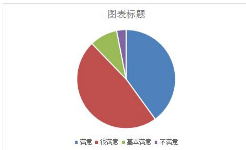
图 7-2 用人单位对毕业生的满意度

体育学院毕业生就业质量以委托第三方（北京智慧无形信息技术有限公司）进行毕业生就业质量调查与评价，最近一次毕业生就业质量调查于 2022 年 10 月完成，据《湖南科技大学体育学院 2021、2022 届毕业生就业质量年度报告》《湖南科技大学体育教育专业质量监测报告 2022 年》显示：聘用过本专业应届毕业生的用人单位对应届毕业生的总体满意度为 96.89%，其中有 47.78%表示“很满意”，有 40%表示“满意”。