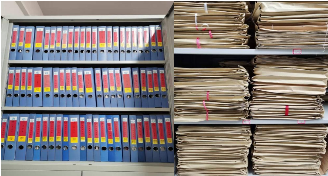
图7-2 教学资料保存完整并按规定存档

相关数据资料完整清晰。教学大纲、考试大纲、教师授课计划表齐全，教学文件和管理过程资料保存完整并能及时归档。