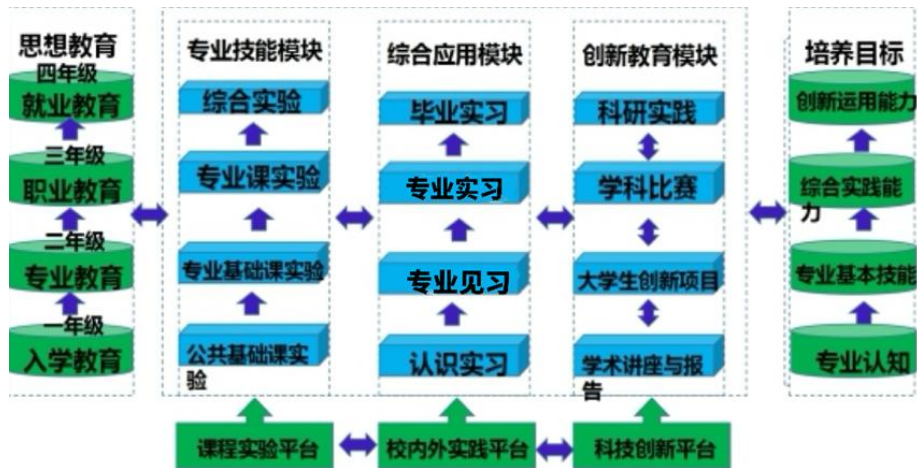
图 2-2 学院多模块立体式实践教学体系

学院落实《湖南科技大学关于进一步加强本科实践教育的指导性意见》，不断推进理论与实践相结合、课堂教学与课外活动相结合、校内与校外实践相结合，构建了“多模块立体式实践教学体系”（见图2-2）。该体系由案例教学、实验教学、课内外专业实践活动、专业社团活动、校外见习实习、学年论文与毕业论文写作、科技创新与学科竞赛项目等模块组成，能使学生的应用能力培养在认识、情感和意志等方面得到协调发展。