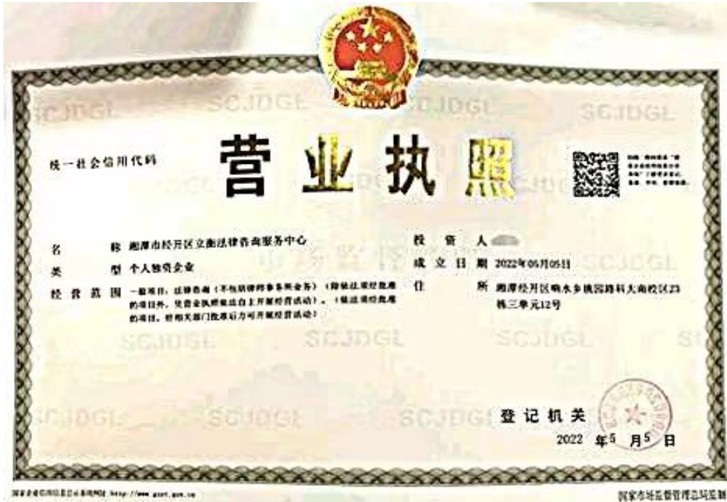
图 2-3 学生创业成果——湘潭市经开区立衡法律咨询服务中心