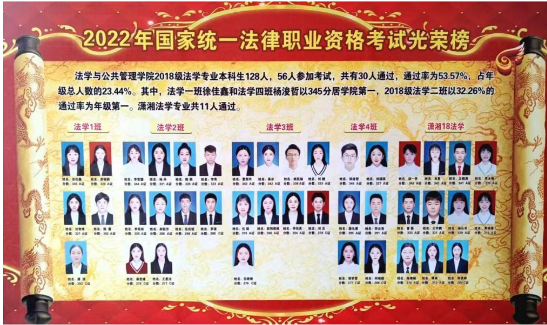
图7-1 2022年学院法学专业学生法考光荣榜

学生就业质量。学院制定的专业培养方案明确规定了“专业毕业要求指标点分解及关联课程”“专业课程体系对应培养目标（能力）的关系矩阵图”，落实培养目标达成度，提高学生就业竞争力。根据毕业生就业跟踪调查，学院近五届毕业生50%左右在湖南省内就业，省内就业的60%以上集中在“长株潭”地区，工作与专业相关度超过70%，基本适应区域经济社会发展需求。其中，法学专业就业行业集中在公检法单位、公司法务部门和律师事务所等社会组织。公共事业管理专业就业集中在基层政府部门、中小学教育机构、各类企业和文化交通等公共事业单位，反映出本专业毕业生就业范围比较广泛（表7-2）。