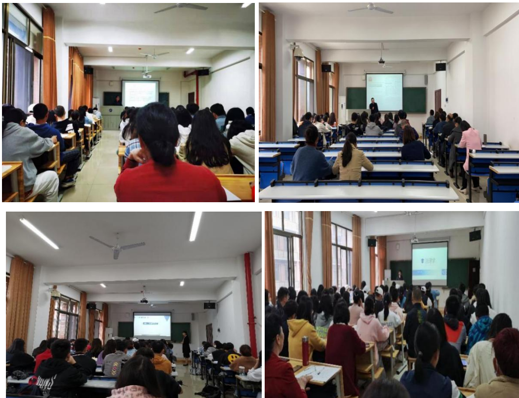
图1-1 学院公开课现场