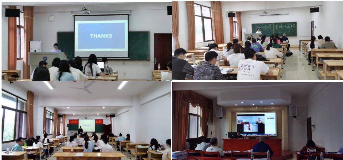
图6-3 毕业论文答辩现场

加强毕业论文管理。 学院加强毕业论文管理，制定学院毕业论文管理规定和撰写规范。落实指导老师责任制，从选题到成稿，严把论文质量关。对参加答辩的所有毕业论文进行多次查重检测，杜绝抄袭、伪造、篡改、代写、买卖毕业论文等问题。学院多次召开全院教师和毕业生毕业论文工作会议，强化毕业生论文质量管理，针对毕业论文撰写规范，面向全院学生对照论文撰写模板进行专题指导讲解，进一步提升毕业论文质量。