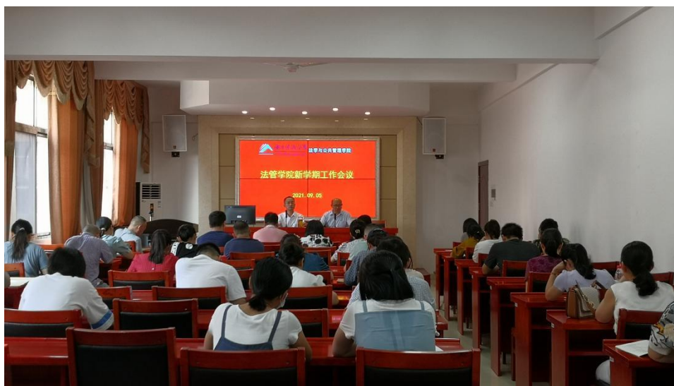
图6-1 学院举行专题教学工作会议

副院长主抓、全员参与的教学质量管理共同体。建立了院级教学指导委员会、学位评定委员会、教学督导等机构或岗位，各司其职，具体负责教学质量监督管理的相关工作。学院不定期组织召开教学工作专题会议、学院教学指导委员会会议，研究解决教学管理问题。要求主管教学院领导和系部主任每学期下课堂进行班风学风巡视检查次数必须达到8次以上，其他院领导每学期必须达到6次以上。在每学期开学的“五个一”检查期间，学院领导必须深入课堂巡查教师授课情况和课堂纪律 ① 。